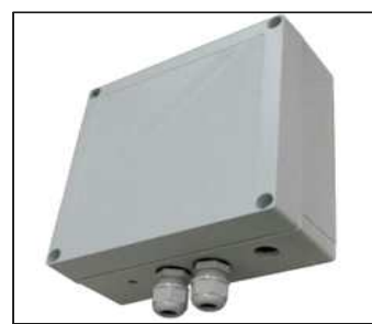
대만 어드밴와이즈가 지난 3월 출시한 장거리 와이파이용 실외용 게이트웨이 (제품명 : HG-3000W)