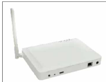
일본 실렉스가 지난 4월 초 출시한 장거리 와이파이 공유기/액세스포인트 (제품명 : AP-610ACH)