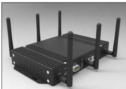
대만 어드밴와이즈가 지난 3월 출시한 장거리 와이파이용 실내용 게이트웨이 (제품명 : HG-3000)